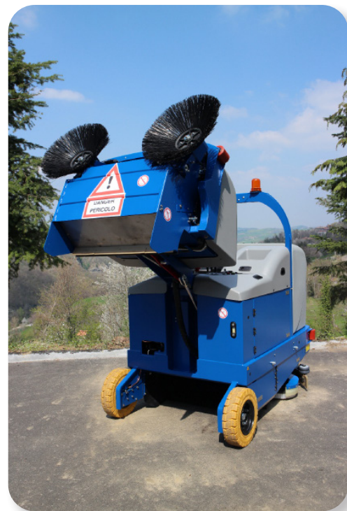
scarico elevato per semplificare il lavoro

very powerful and easily accessible suction motor