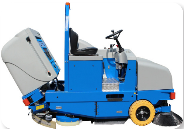
facile accesso per eventuale manutenzione