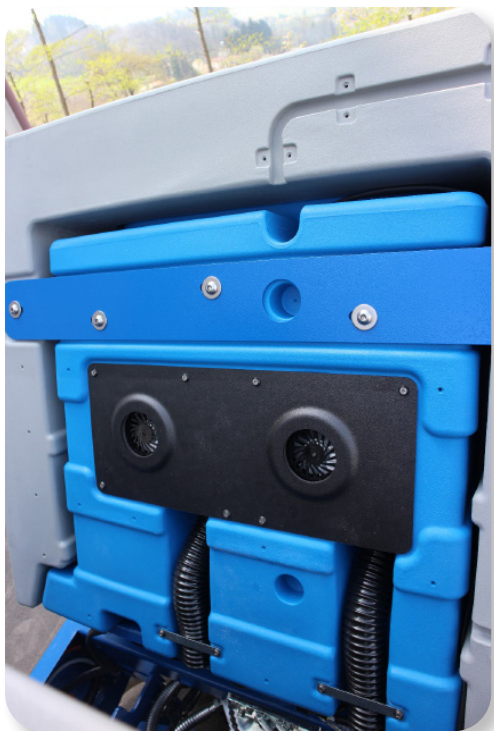
motore di aspirazione molto potente e facilmente accessibile

very powerful and easily accessible suction motor